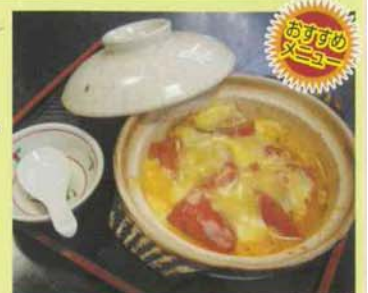
トマトとチーズのホットな関係...¥1,000