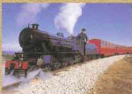
虹の郷 大自然に包まれた中に、イギリス村やカナダ村などの美しい街並、日本の良さを再発見する欧の村や日本庭園、そして英国製のLMSなど、やすらぎを大切にした新しい公園です。