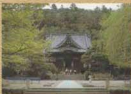
修善寺 弘法大師が開基した霊跡で文豪岡本綺堂が書き下ろしたあまりにも有名な(修善寺物語)の舞台です。