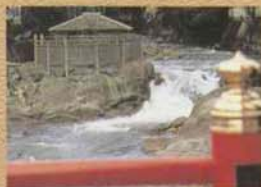
とっこの湯 弘法大師が聖見したと言われる修善寺最初のいで湯。いまなお柱川のほとりにこんこんと湧きつづけております。