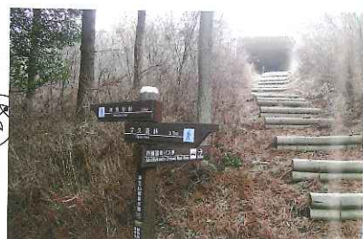
▲カルバートがある土肥峠