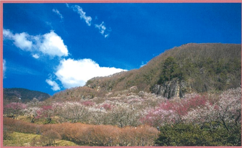
湯河原梅林(神奈川県湯河原町)