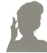
K.I 様 40代女性

びわを連想する甘い香りで、手に塗るとほんわか温かくて不思議な気分でした。この温かさは一体...?! パサついた髪が気になっていましたが、サラサラ感・ツヤ感がアップして嬉しいです。