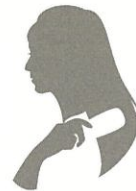
K.S 様 50代女性

びわを連想する甘い香りで、手に塗るとほんわか温かくて不思議な気分でした。この温かさは一体...?! パサついた髪が気になっていましたが、サラサラ感・ツヤ感がアップして嬉しいです。