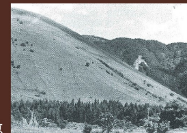
昭和 30 年頃の鉢窪山 Mt. Hachikubo covered with grass, photograph taken around 1949

Various plants are available around the mountain, such as primulaceae and spiceberry.