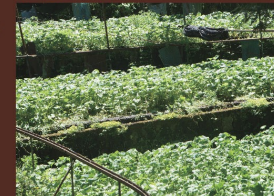
わさび沢 Wasabi field