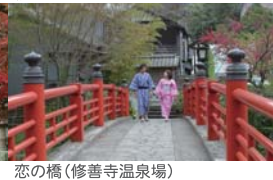
恋の橋(修善寺温泉場)