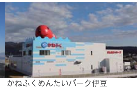
かねふくくめんたいパーク伊豆