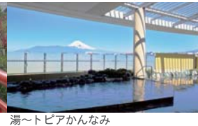
湯～トピアかんなんみ