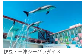
伊豆・三津シーパラダイス