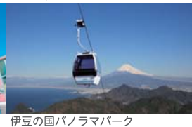
伊豆の国パノラマパーク