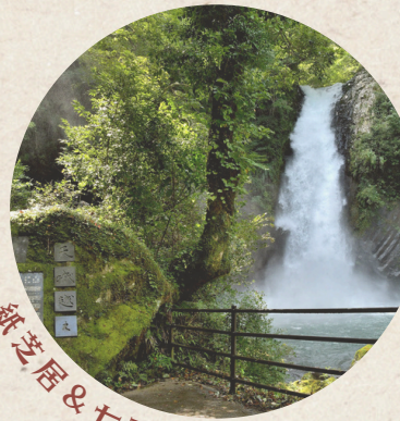
紙芝居&七不思議ツアー