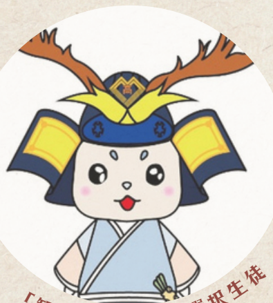
「観光ビジネス」選択生徒