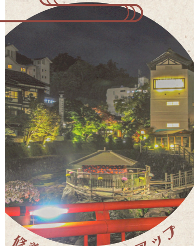
修善寺温泉ライトアップ