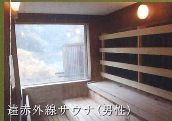
遠赤外線サウナ (男性)