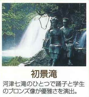
初景滝 河津七滝のひとつで踊子と学生のブロンズ像が優雅さを演出。

フリーストップバス 「浄蓮の滝～椎の木上」間の路線バスは、カーブや勾配、トンネル内などを除き、バス停以外でも乗り降り自由です。どうぞご利用ください。 株式会社東海バス TEL.0558-72-1841