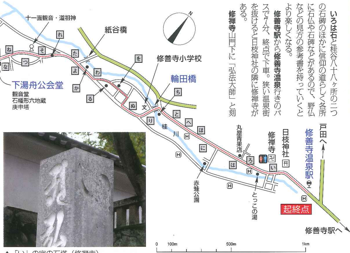
▲「い」の字の石塔(修禪寺)