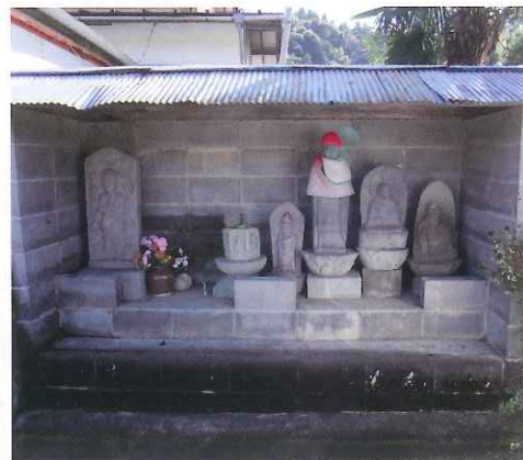
▲下湯舟公会堂の石造物