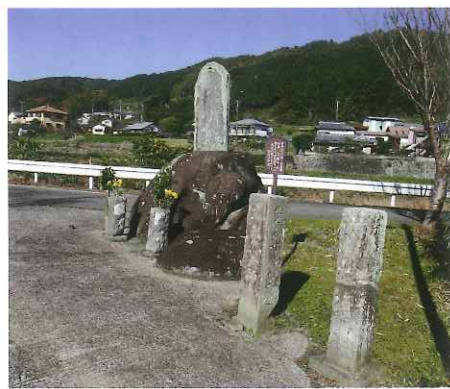
▲いろは石と88ヶ所碑