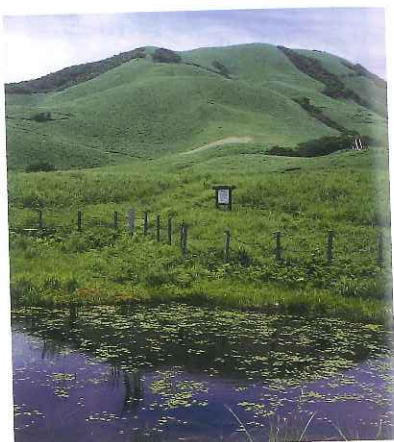
▲桃野湿原から三筋山を望む

修善寺駅から八丁池口行きのバスで1時間13分、終点まで下車。八丁池口行きのバスは季節運行のため注意のこと(37頁参照)。 八丁池口でバスを降りたらスギ・ヒノキ林の舗装された寒天林道を上って行く。左に大きくカーブした所を右に折れて、道なりに進むと分岐。案内図と道標がある。ここを戻るように上って行く。開けた所から灌木林に入り、アセビの林を抜ける