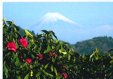
展望台からの富士山

昭和の森会館に隣接する54,072m 2 の自然公園。4月中旬～5月上旬には、天城シャクナゲや西洋シャクナゲ、さらに天城に自生する山野草を見ることが出来ます。また展望台からは天城の山々と富士山が望めます。園内は全長約2kmの遊歩道が整備されています。