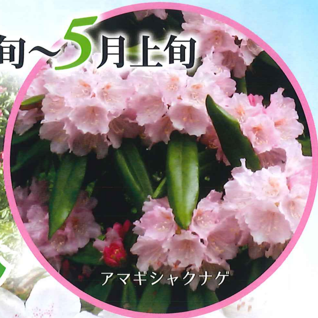
アマギシャクナゲ