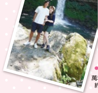
萬城の滝から車で 約5分(3.1km)