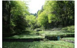
筏場のワサビ田 ・わさびセンターから5.6Km ・萬城の滝から4.7Km