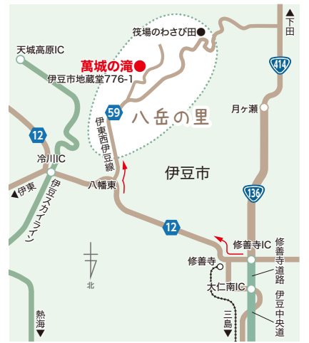
修善寺道路「修善寺IC」から車で約14km(約25分)