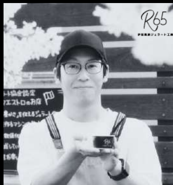
ジェラート工房「R65」 オーナーパティシエ ジェラートマエストロ