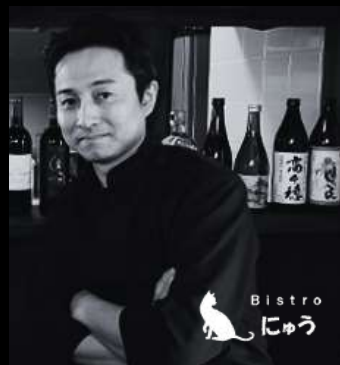
ビストロ「にゅう」 オーナーシェフ ソムリエ