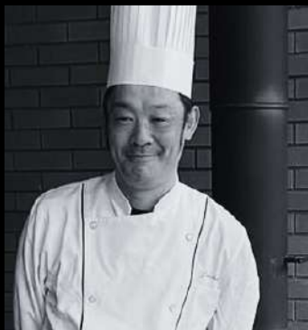
フレンチ ホテル レストラン 料理長