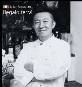
イタリア料理 「レガロテッラ」 オーナーシェフ